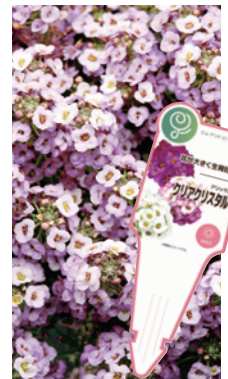
ラベンダーシェード

*ラベルは予告なく変更することがございます。*プラグ苗の入り数は目安です。生産状況により変動する場合がございます。予めご了承ください。