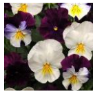
ベリーズアンド クリームミックス