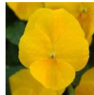
ゴールデンイエロー