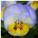
ブルーベリーソワール インブ (右)