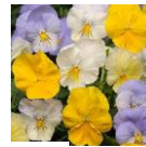
パステルミックス