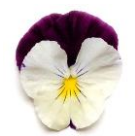
バイオレット ウィング